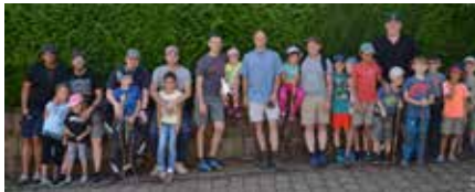
Übernachtung 2017

Achtung Papas, aufgepasst! Es ist wieder soweit. Habt ihr Zeit und Lust für gemeinsames Spielen, für die Natur und für Gemeinschaft mit anderen Vätern? Dann kommt mit!