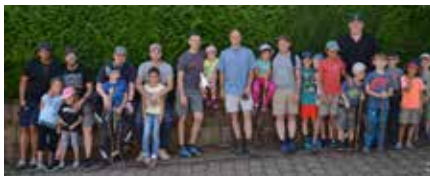
Übernachtung 2017

Achtung Papas, aufgepasst! Es ist wieder soweit. Habt ihr Zeit und Lust für gemeinsames Spielen, für die Natur und für Gemeinschaft mit anderen Vätern? Dann kommt mit!