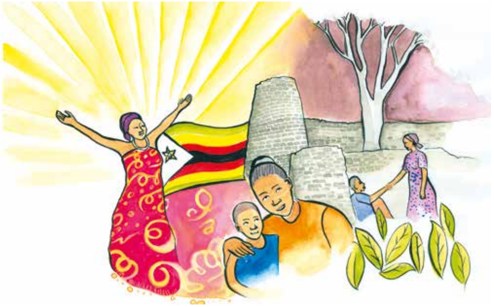
Bild: Nonhlanhla Mathe „Rise! Take Your Mat and Walk“

Protestantische Kirchengemeinde Herschweiler-Pettersheim