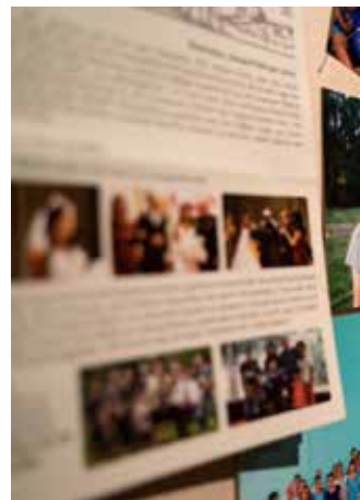
An der „Missionswand“ in der Kirche finden Sie weitere Informationen.